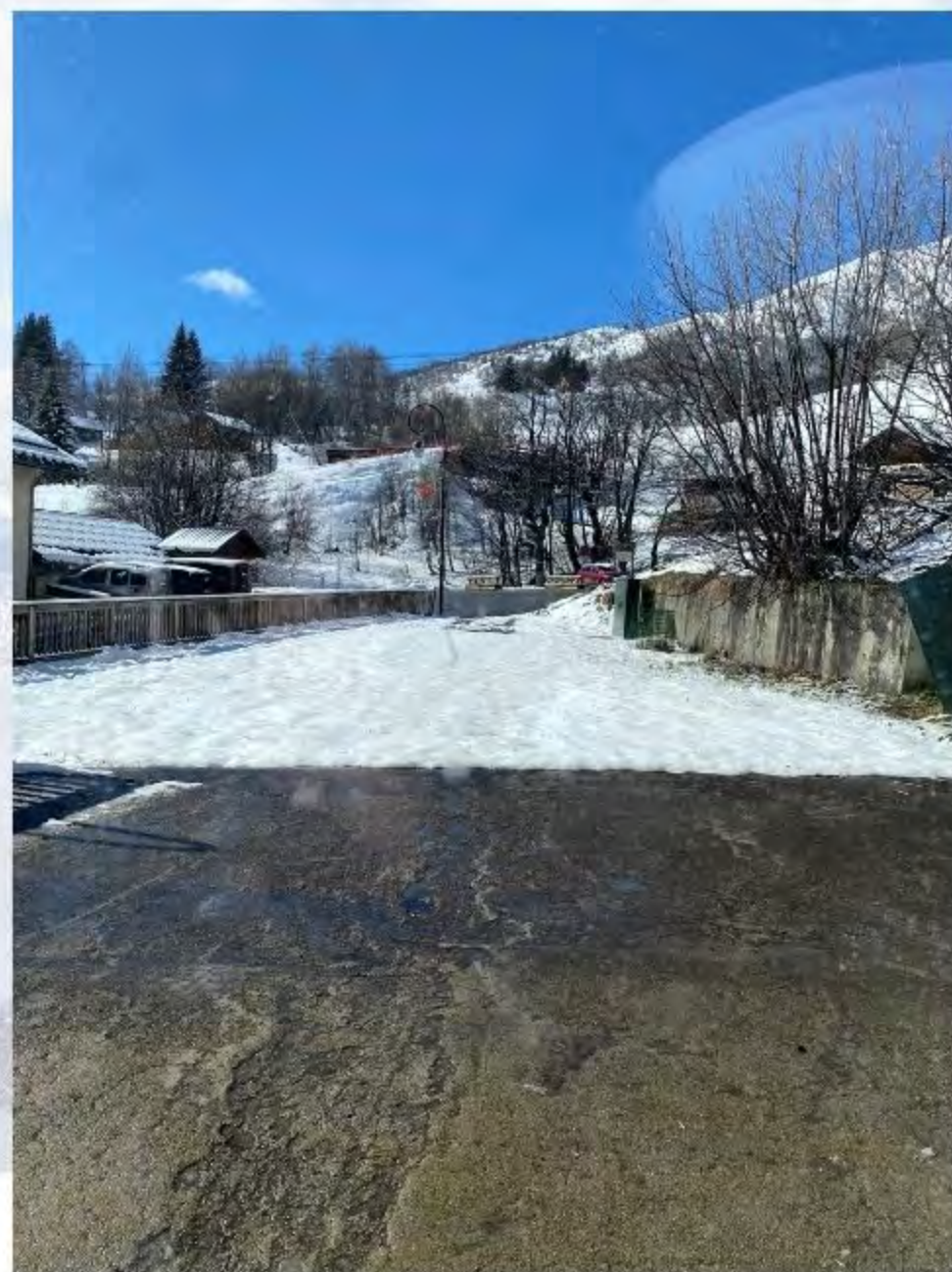
PETIT TERRAIN EXTERIEUR