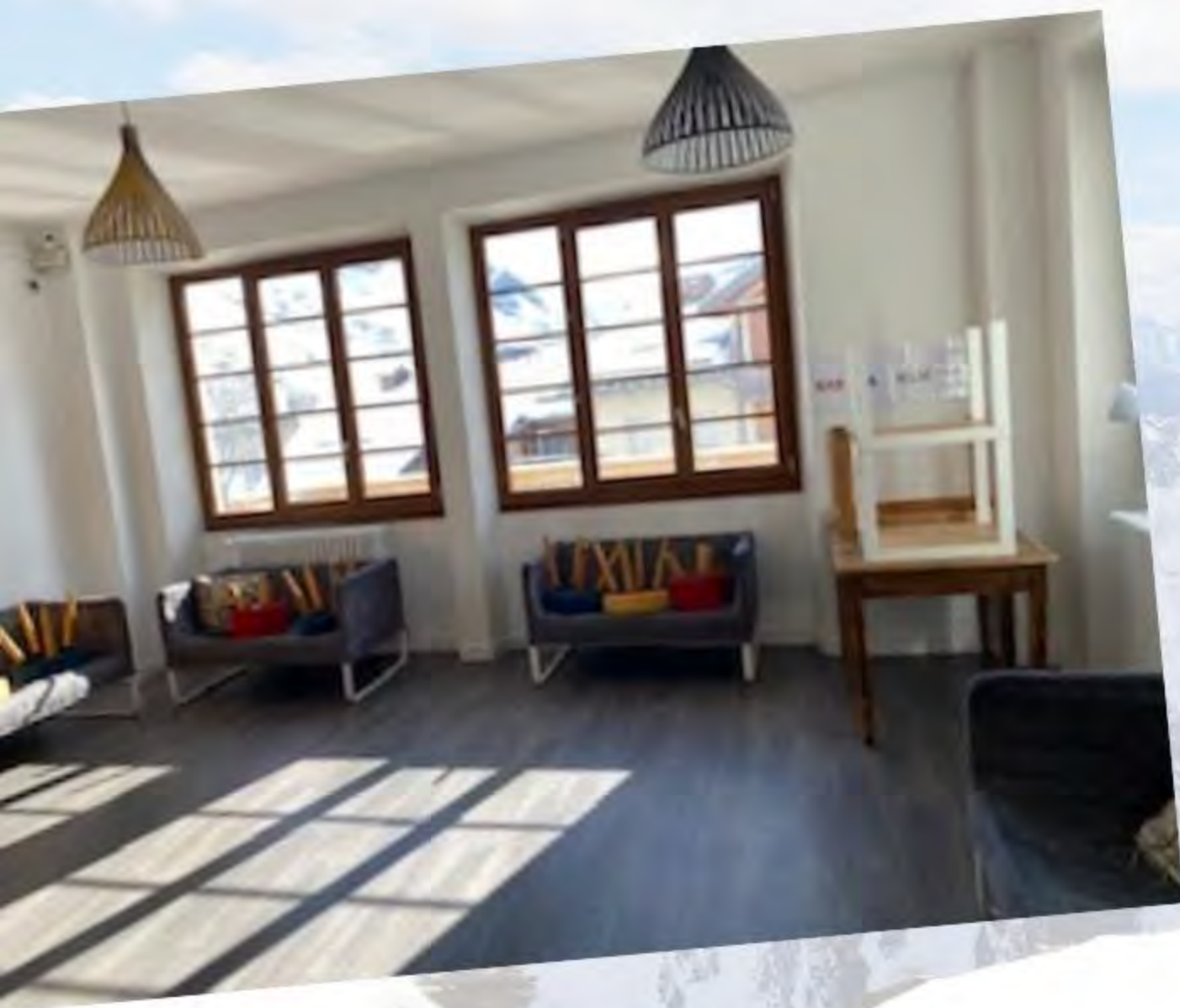
3 SALLES D'ACTIVITÉS