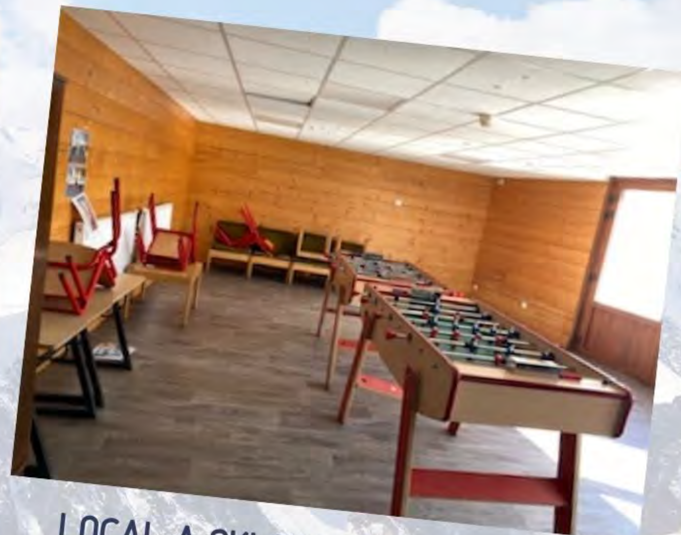
LOCAL A SKI CHAUFFÉ DANS LE CHALET